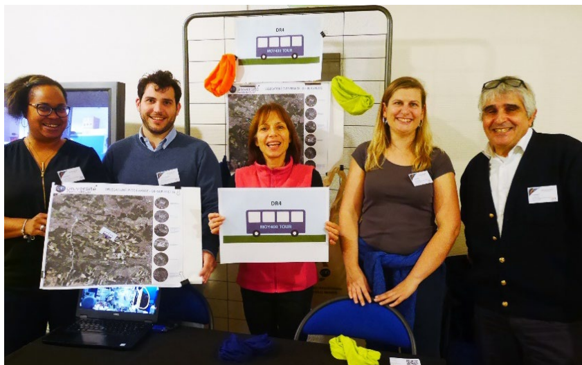
La QVTeam de la DR04, porteuse du projet « MOY400 Tour », une visite guidée ludique de la délégation.

Cet appel à projets s'adresse à l'ensemble des unités du CNRS. Il s'agit de projets collectifs associant l'ensemble des agents d'une unité ou de plusieurs unités (chercheurs et chercheuses, ingénieurs et ingénieures, techniciennes et techniciens, administratifs, doctorants et doctorantes).